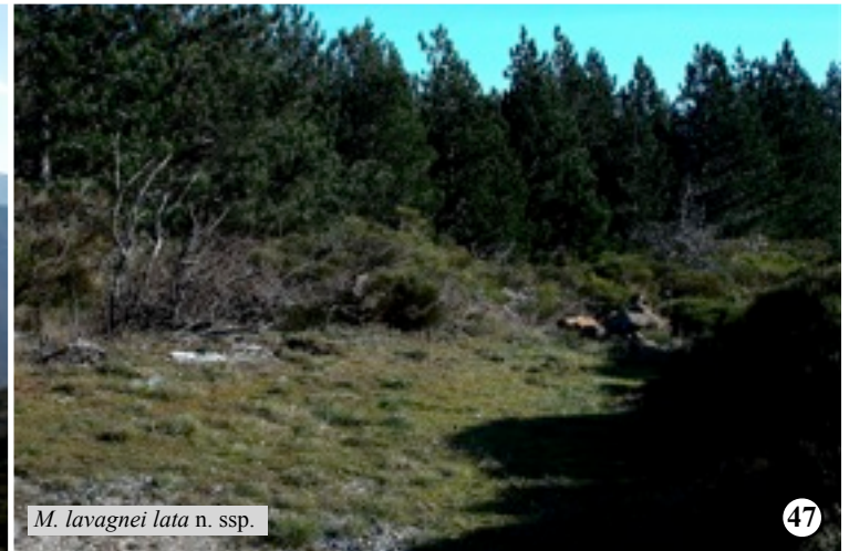
M. lavagnei lata n. ssp.